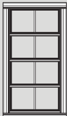
Système de fenêtre simple 2pi - 4pi

Les fenêtres WeatherMaster sont fabriquées à partir de ViewFlex, un vinyle qui est disponible en 4 teintes différentes, permettant 75% de ventilation, et sont pratiquement sans entretien. Avec une variété de couleurs pour répondre à vos besoins spécifiques, les produits WeatherMaster® sont un moyen économique de transformer la fonctionnalité d'une pièce tout en ajoutant beauté et valeur à votre maison.